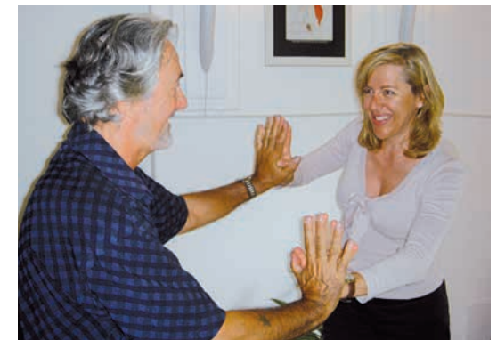
Nicht nur über Gefühle reden, sondern sie spüren (hier z. B. Kraft)

Körperzentrierte Psychologische Berater(innen) IKP arbeiten mit einem breiten Spektrum körperlicher, medizinisch ungefährlicher, vom Standpunkt der Beweglichkeit und Trainiertheit her gesehen, gesundheitsfördernden Übungen. Bei den körpertherapeutischen Interventionen werden einerseits Ausdrucksübungen in den psychosozial-beraterischen Prozess einbezogen (Seelisches wird körperlich ausgedrückt), andererseits werden körperliche Erfahrungsübungen angewandt, die auf die Gefühlswelt einwirken. Typisch für den IKP-Ansatz ist auch die verhaltensmodifizierende Arbeit über das Körpergedächtnis.